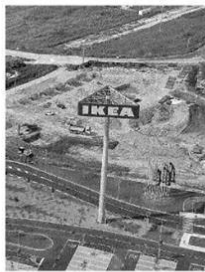
L'area Ikea ai Navicelli

2015, il Comune come creditore nei confronti della Sviluppo Navicelli, fallita nel 2015 – dice un comunicato – il Comune è creditore riconosciuto di 2.800.000 di euro per mancata realizzazione di una parte di opere. Due anni prima del fallimento di Sviluppo Navicelli ha cessato l'attività l'agenzia presso cui erano appoggiate le fidejussioni a garanzia. Sviluppo Navicelli aveva tempo fino al 2017 per realizzare le opere in questione: il fallimento della società ha fatto il resto. Comunque il Comune di Pisa è convintissimo di poter rientrare o con i crediti dal fallimento o con chi eventualmente dovesse subentrare alla società fallita. Il soggetto che acquistò le aree di Sviluppo Navicelli tramite la procedura fallimentare per poter orientare i permessi a costruire dovrà versare i crediti che vanta il Comune o realizzare le opere incomplete».