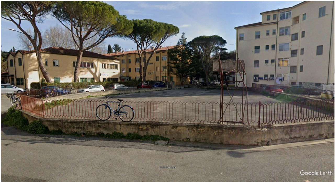
Largo Petrarca oggi: l'ex-Circoscrizione chiusa, il campo da basket abbandonato