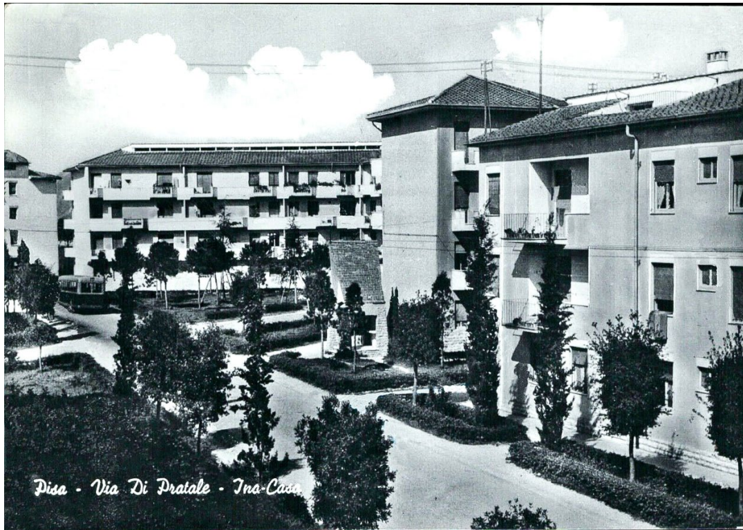
Le piantumazioni degli anni Cinquanta