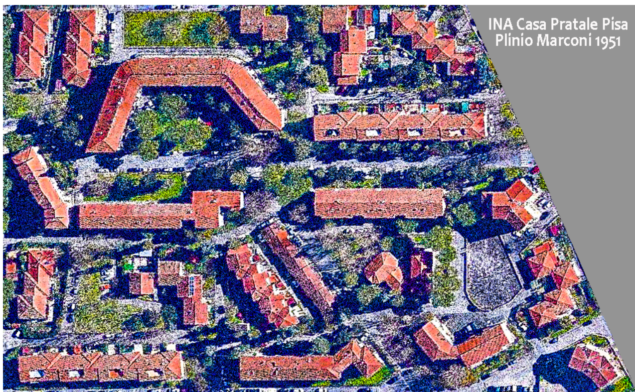
Il quartiere oggi: spazi edificati, spazi aperti, edifici, verde.