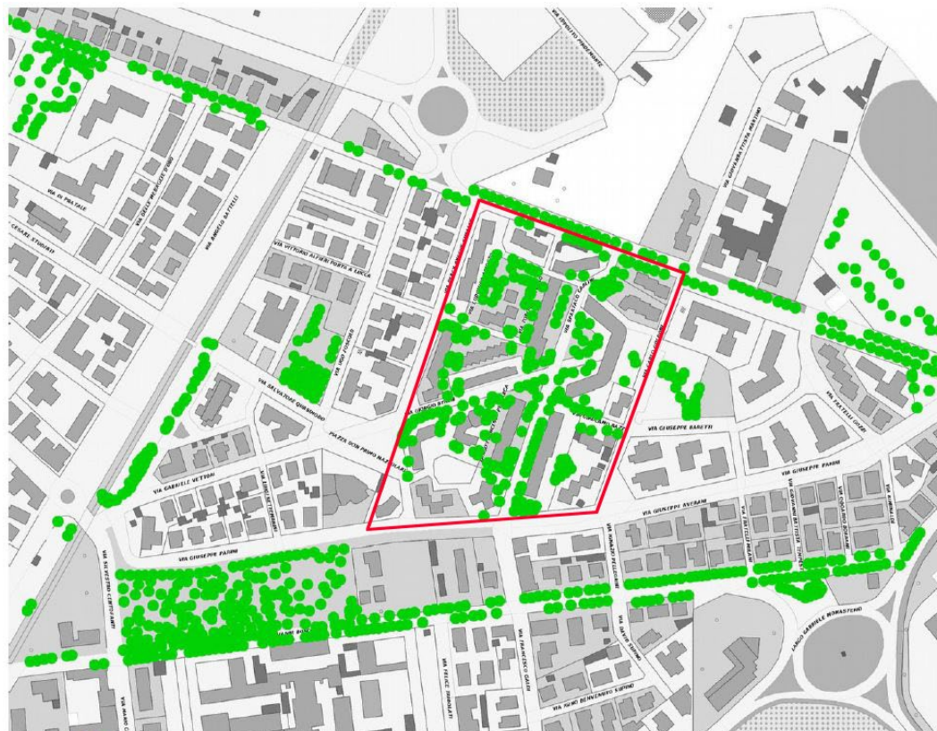
Pratale Ina-Casa è l'unica area costruita della zona riccamente dotata di alberi: una vera isola verde.